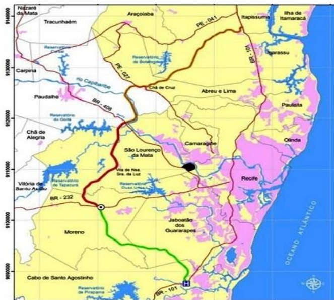
Figura 1. Região Metropolitana do Recife, 2018

O município de Recife foi fundado em 1537, e é hoje a maior e uma das principais cidades do Brasil. É a principal cidade da Região Metropolitana do Recife composta por 15 municípios (FIGURA 1).